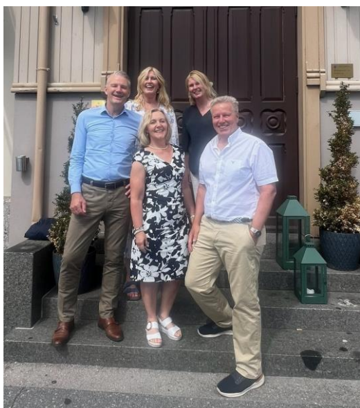
NHO Vestfold og Telemark med regionskontor i Larvik/Vestfold