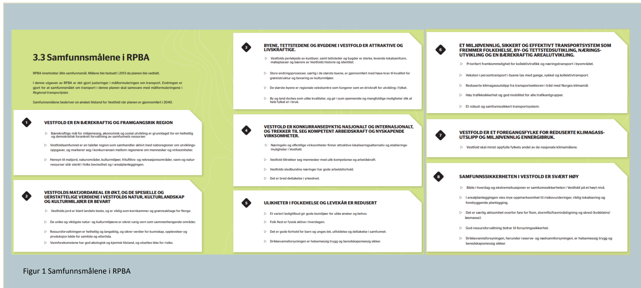
Figur 1 Samfunnsmålene i RPBA

Handlingsprogrammet skal konkretisere hvordan vi skal nå samfunnsmålene. Målene har underpunkter som utdyper målene. Punktene under samfunnsmål 6, er videreført som effektmål i RTP.