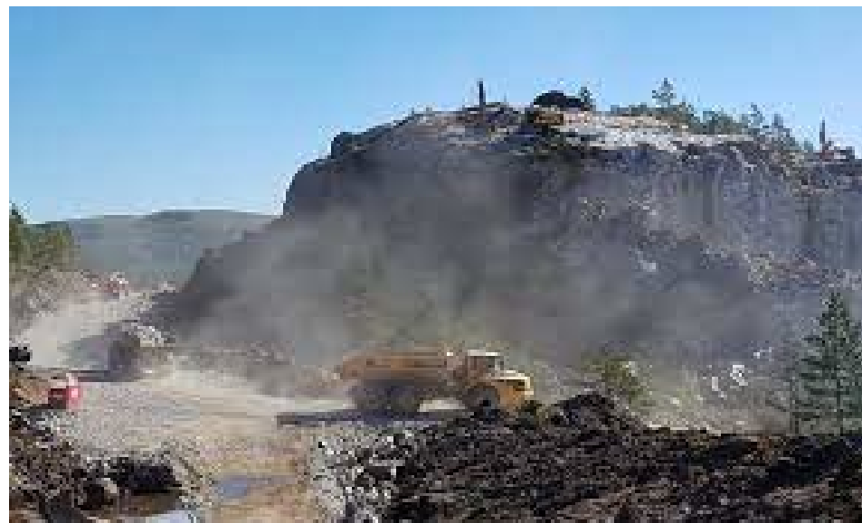
Figur 2. Fotokreditering. «La Naturen Leve»

Kompakt by- og stedsutvikling og utvikling/transformasjon av allerede bebygde områder er et klimatililtak i seg selv. Det sparer viktig natur, arealer som binder CO2 og bidrar til klimatilpasning, i tillegg til å ivareta livsgrunnlaget til dyr og planter. Kompakte byer og tettsteder bruker også mindre energi per person til transport, og muliggjør økt bruk av deleløsninger.