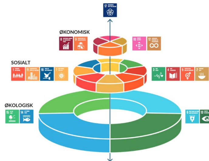
Figur: FNs bærekraftsmål som viser at økonomisk bærekraft er avhengig av at økologisk og sosial bærekraft. Kilde: Azote for Stockholm Resilience Centre, Stockholm University