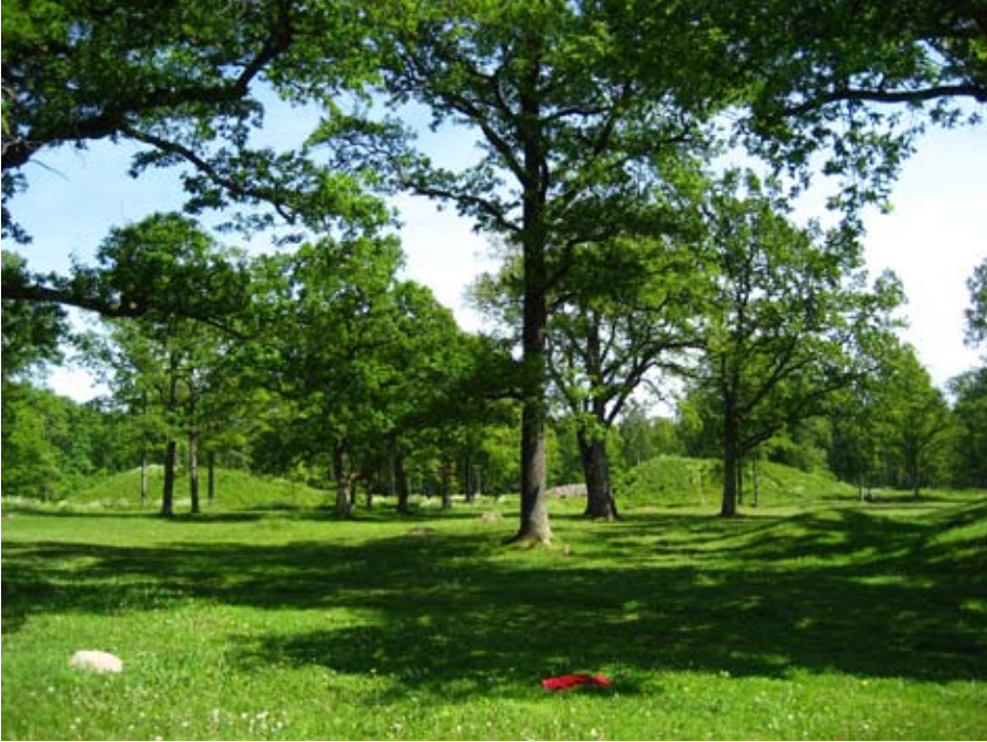
Fig. 1. Borregravfeltet i dag.

sin tilstedeværelse skulle endre framtiden. Haugene har stått og står fremdeles sentralt i diskusjoner om rikssamling, myter, historieskriving og forståelsen av både jernalderen og overgangen til kristendommen. Den posisjonen Borre inntar som Nordens største samling med storhauger gjør stedet sentralt, men samtidig kommer man ikke fram til noen endelige svar. Haugene på Borre vil fremdeles fremtvinge nye diskusjoner og være et referansemateriale som man forholder seg til. Hver generasjon skriver sin egen historie og Borres rolle vil også i fremtiden være med å generere ny kunnskap om vikingtidens fortid og framtid. Likevel har det helt frem til i dag vært noen autoritative verk som har stått sentralt i den offentlige og kollektive forståelsen av Borre. Med dette utgangspunktet vil vi presentere hvilke forståelser av Borre som har blitt formidlet og diskutere teoretiske aspekter ved fortidens bruk og formidling av fortiden til forskjellige formål i nåtiden. Hva kan man lære av fortiden, og hva kan man lære av hvordan fortiden tidligere har blitt forstått og formidlet?