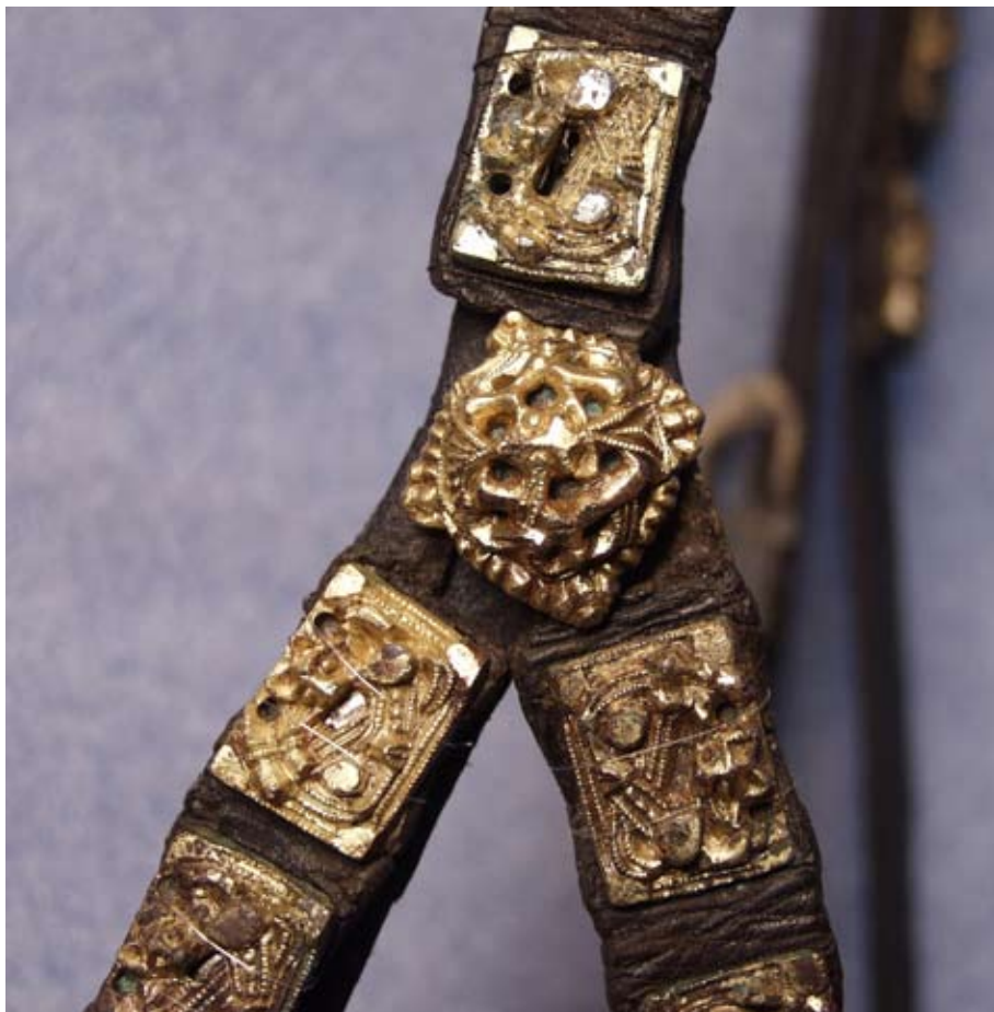
Fig. 4. Del av beslag til seletøy funnet i Skipshaugen, Haug I i 1852.

en nasjonal identitet gjorde at det sistnevnte skipet ble gravd opp på ”rett tid”. I 1852 var man ikke klar over betydningen av funnet av Borreskipet, og når viktigheten av vikingskipene i norsk historie var blitt etablert hos folk og fagfolk, så kom Skipshaugen i skyggen av Oseberg og Gokstad, hvilket det må sies å være enda.