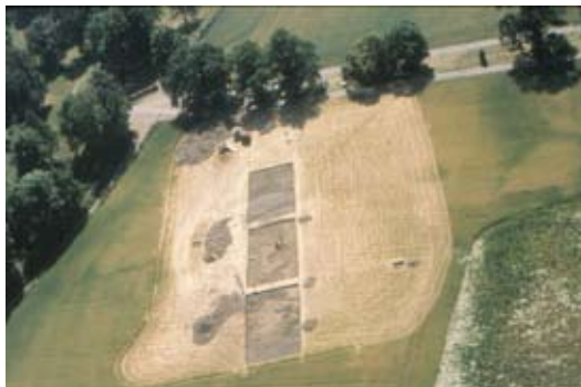
Fig. 6. Flybilde etter undersøkelsen av Skipshaugen i 1989.

være farget av hans tid og de er følgelig ikke samtidsskildringer av vikingsamfunnet.