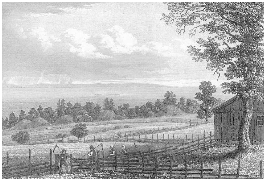
Fig. 2. Flintoes bilde av Borrehaugene ble laget omkring 1832.

trykking av sagaer. Slik sett er det Snorres kongesagaer som har vært med å bygge opp forestillingene og formidlet kunnskap om Borre de siste 170 årene. I 1899 kom folkeutgaven av kongesagaene, og dette ble sett på som et nasjonalt prosjekt som økonomisk ble finansiert av det norske Stortinget ved egen bevilgning.