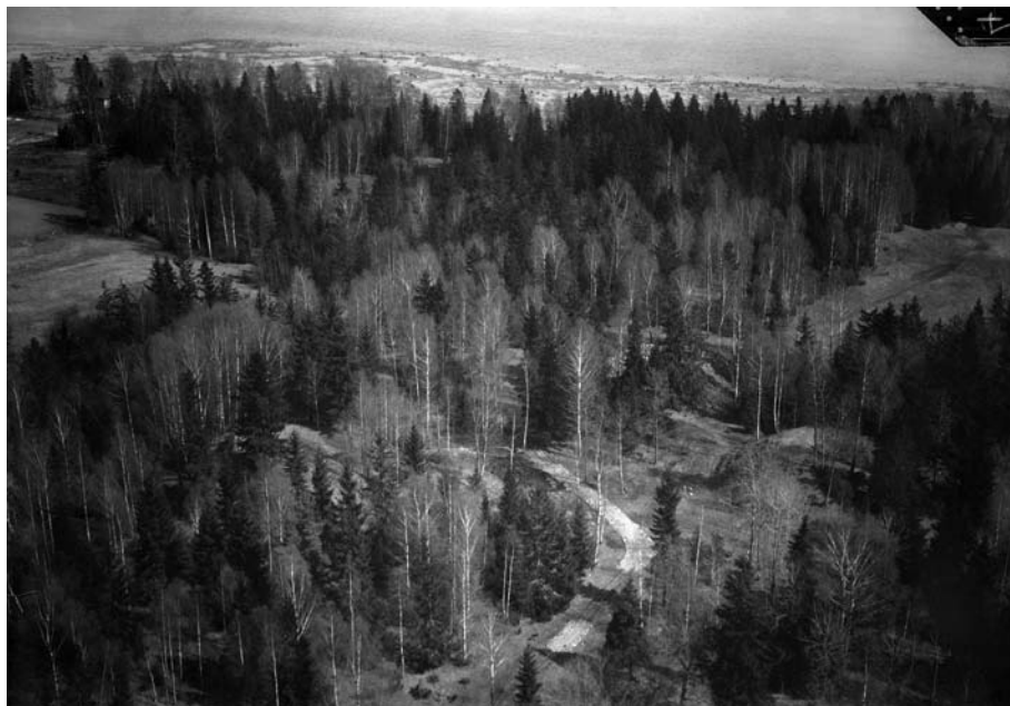
Fig. 5. Flyfotografi tatt over Borre i mai 1928, foto nummer 1.

stemt over forfatningen disse fyrstelige haugene var i, og som lå i et nedslående villniss av forfalleen skog omgitt av delvis sumpmark hvor man kun i tørre somrer kunne bevege seg relativt fritt mellom de ærverdige gravminnene (fig. 5). Og det var umulig å få et glimt av Oslofjorden fra haugene selv om de kun lå ca. hundre meter fra stranden. I sin konklusjon fremsetter Brøgger i 1916 derfor et program: