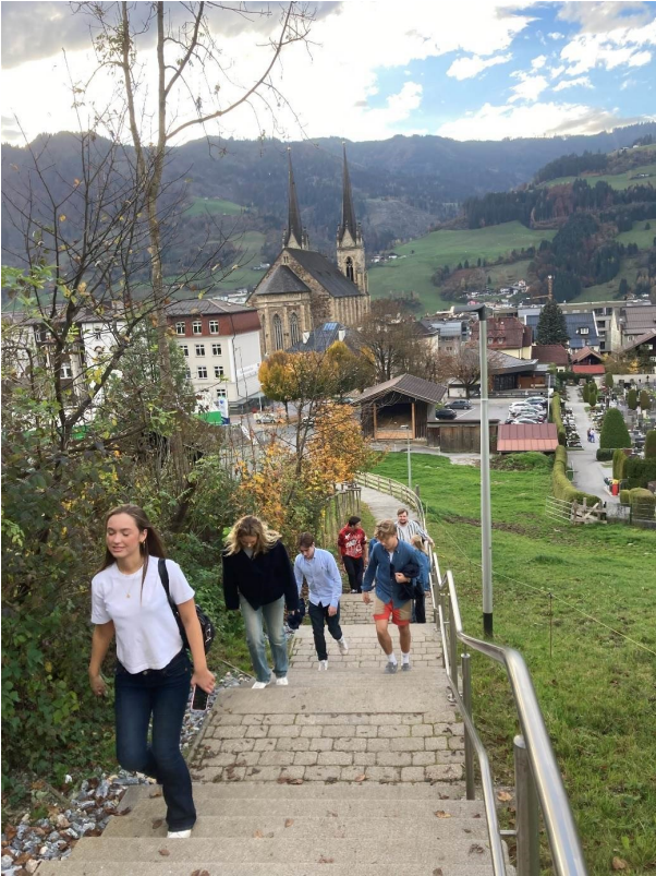
Vi fikk en omvisning i St. Johann

Vi var en tysk klasse fra vg2 som fikk muligheten til å dra på en studiereise til den lille byen St. Johann i Østerrike, vi fikk muligheten til å utforske ulike fine steder og lære om kulturer og ulike ting om denne byen, vi var på en skole hvor vi lærte om hvordan deres skolesystem var og lærte hvor annerledes dette var fra Norge.