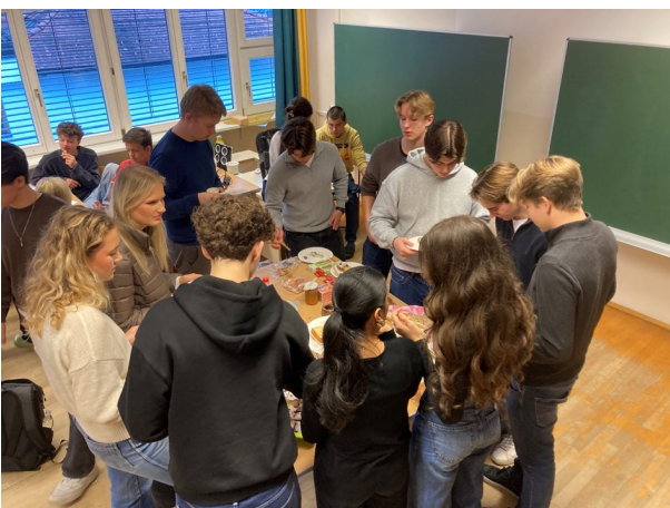
Vi tok med norsk tradisjonell mat som østerrikerne kunne smake på.