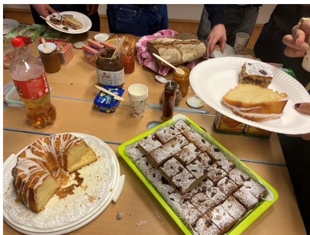
Vi fikk smake på tradisjonell østerrisk mat. Det var mye søtsaker for det meste.