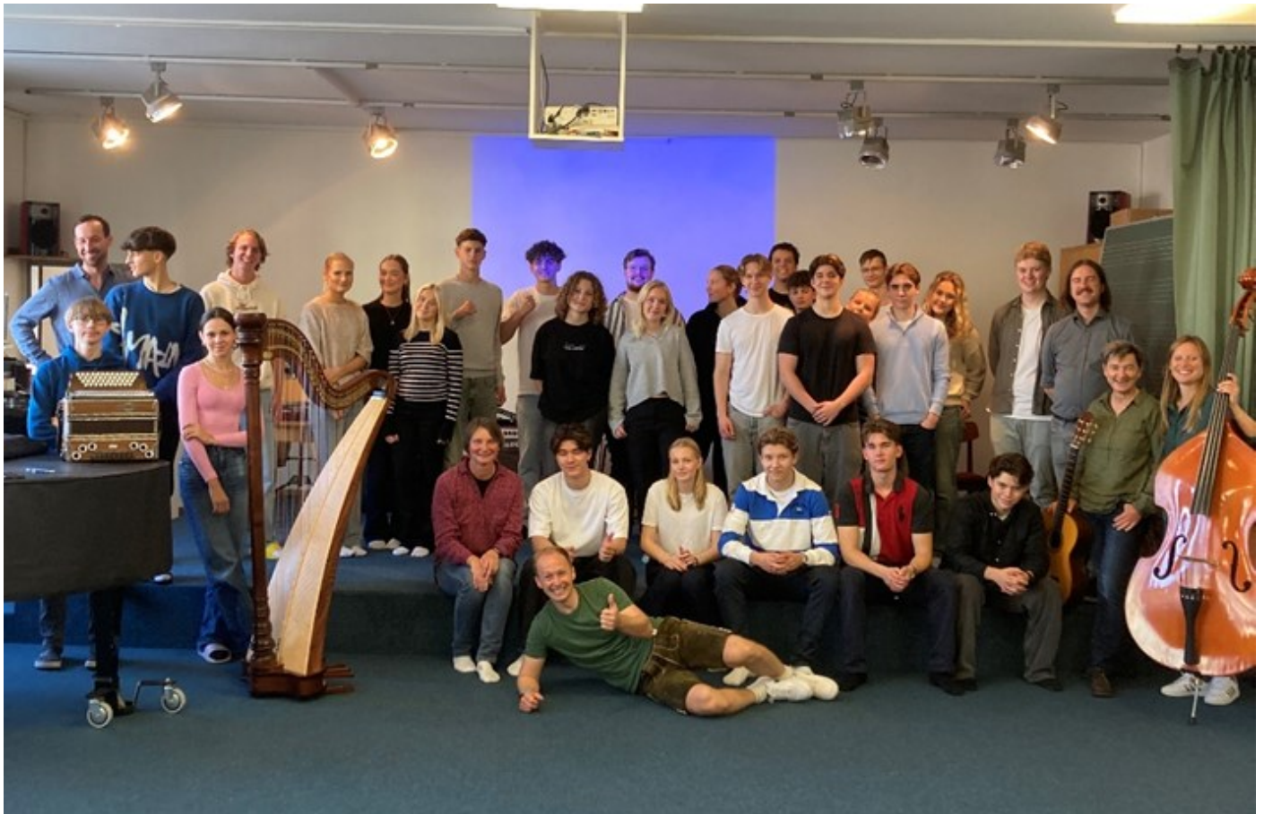
Vi hadde det veldig gøy og var med på en typisk østerisk musikktime hvor vi lærte både danser og sanger