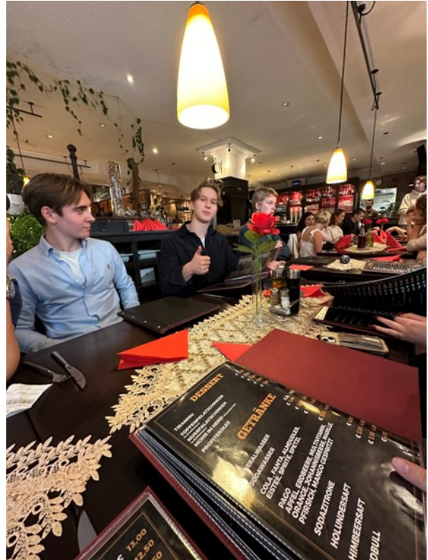
Vi var på restaurant med disse skoleelevene fra den lokale skolen og vi måtte utfordre oss selv til å snakke tysk.